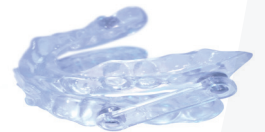
AMO LPP 2451474