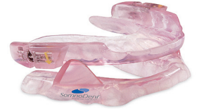
Somnodent® LPP 2407378